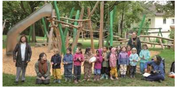
Vorschulkinder und Erzieherinnen der KiTaVilla Wichtel bei der Eröffnung des Spielplatzes in der Estenfelderstraße.

Ansprechpartnerin: Kerstin Hoebusch, Tel: 0173-9701059 Quartiersmanagement-Versbach@Awo-Unterfranken.de