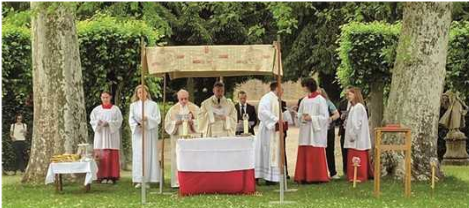
Fronleichnamsgottesdienst im Rondell im Staatl. Hofgarten Veitshöchheim