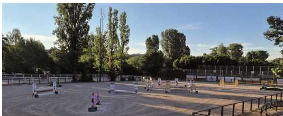
Die Reitanlage in der Mergentheimer Straße 13d ist am 3. Juli Wochenende Treffpunkt für alle Pferdebegeisterte.