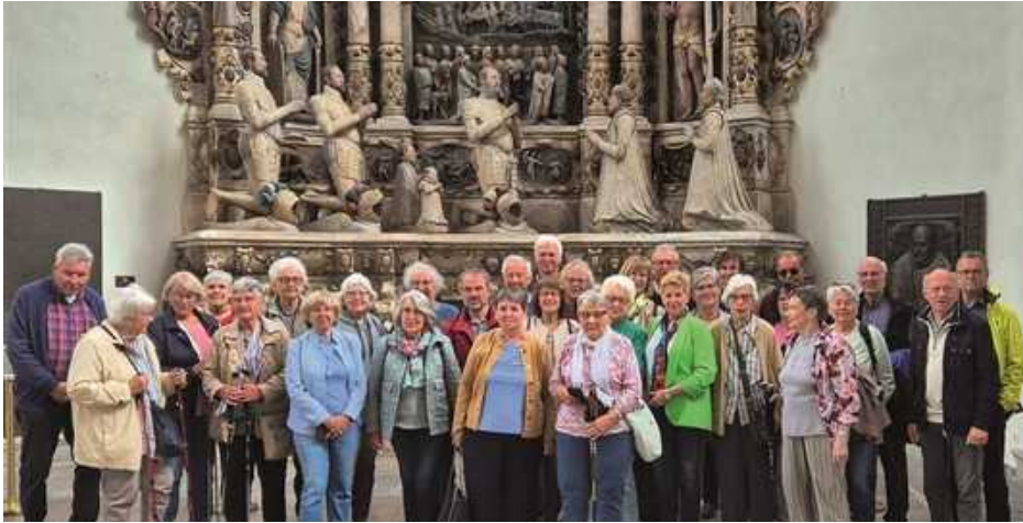
Mitglieder der Senioren-Union-Lengfeld in der evangelisch-lutherischen Stadtkirche St. Moriz, die Teil des Altstadt Besuchs in Coburg war.