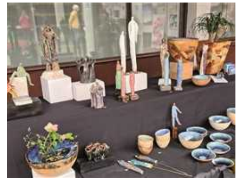
Kunsthandwerk gab es auf dem Ostermarkt der Pfarrgemeinde Oberdürrbach zu kaufen.