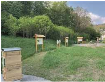
Bienenlehrpfad in Oberdürrbach