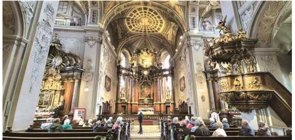
Mitglieder der Senioren Union Lengfeld in der Basilika-zum-Heiligen-Blut in Walldürren bei Ihrer Tagesfahrt in den Odenwald.