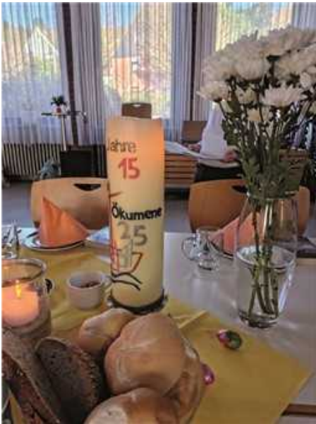
Gedeckter Tisch bei der Agapefeier des Forums Ökumene Dürrbachtal am Gründonnerstag.