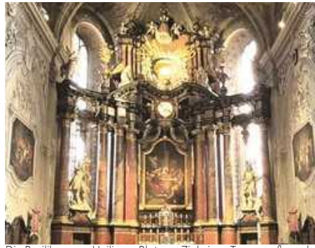
Die Basilika-zum-Heiligen-Blut war Ziel eines Tagesausflugs der Senioren Union Lengfeld.