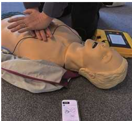
Die Ersthelfer App „TEAM Bayern - Lebensretter“ alarmiert gezielt qualifizierte Helfer. Diese schnelle Hilfe kann Leben retten.