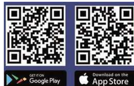
QR-Codes, zum Download der kostenlosen App „TEAM Bayern - Lebensretter“.

E-Mail an: zrf-ersthelfer@ira-wue.bayern.de.