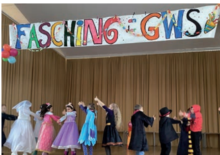
Faschingsfeier in der Aula der Gustav-Walle Schule

Um 11 Uhr zogen die Kinder dann in einer Polonaise in ihre Klassenzimmer zurück. Dort erwarteten sie Quarkinis, die der Elternbeirat und die Bäckerei Rösner gestiftet hatte. Bis zum Schulschluss wurde in den Klassen noch weitergefeiert.