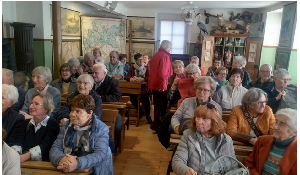
Senioren aus dem Dürrbachtal im Schulmuseum in Lohr am Main

Frankenstr. 193-195, 97078 Würzburg Tel. 0931 2098-0 www.hans-sponsel-haus.de