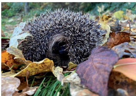
Igel im Laub