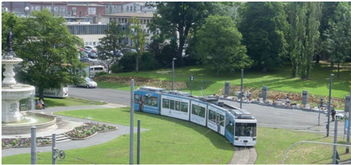
rechts der Gleise: Denkort Deportation am Hauptbahnhof