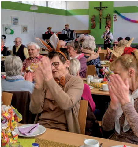
Senioren aus Oberdürrbach beim Seniorenfasching im Pfarrsaal in Oberdürrbach.