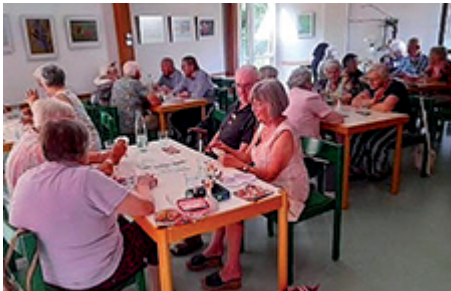
Senioren beim Spielen im Rahmen des Lengfelder Treffs der AWO.