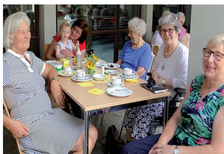
Teilnehmerinnen am Sommerfest des Seniorenkreis St. Josef

Tel: 0931 / 9 55 43 pg.duerrbachtal@bistum-wuerzburg.de www.pg-duerrbachtal.de