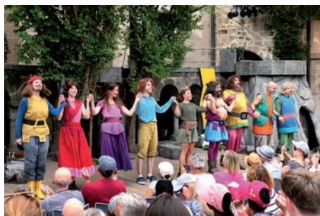
Bühne der Kreuzgangspiele in Feuchtwangen