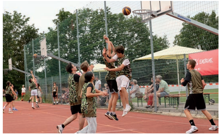
In-Action 3x3-Wettbewerb.

Sport Shop Würzburg , Bahnhofstraße 1, Tel. (0931) 12848, www.sportshop-wuerzburg.com , Mail: info@sportshop-wuerzburg.com Öffnungszeiten: Di. bis Fr. 10 bis 18 Uhr, Samstag 10 bis 14 Uhr.