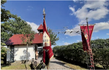
Versbacher Rochuskapelle geschmückt für das Rochusfest