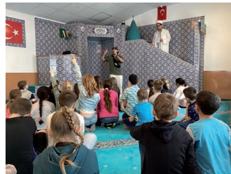
Text: und Bild: Meike Gressel

Im Juni besuchten die Schülerinnen und Schüler der 3. und 4. Klassen mit den Religionslehrkräften die Moschee in der Aumühle . Um allen Kinder gerecht zu werden, nahmen der Iman und seine Frau sich an zwei Donnerstagen im Juni die Zeit um jeweils 2 Klassen zu begrüßen. Außerdem waren noch zwei junge Muslime anwesend. Gemeinsam wurde den Kinder nicht nur eine Führung durch die Moschee geboten, sondern auch alle Fragen zur Weltreligion des Islams beantwortet. Besonders beeindruckte die Kinder, dass einige Mitschüler und Mitschülerinnen, die muslimisch sind, bereits Teile des Korans in arabischer Sprache auswendig können und diese frei vortragen.