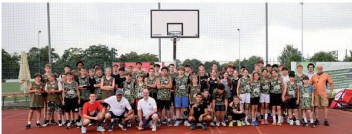
Siegerehrung WVV Jugend-Streetball-Turnier.

Weil die Mannschaften der Finalrunden allesamt knapp 45 Minuten im Regen ausharrten und sich damit als siegeswürdig erwiesen, sollten ausnahmsweise alle Erst- bis Viertplatzierten der U14, U16 und U18 einen Siegerpokal erhalten. Bei wiedereinsetzendem Regen wurden die Trophäen überreicht und die bis dahin gezeigten Leistungen somit angemessen gewürdigt – und so nahm die Premiere des WVV Jugend-Streetball-Turniers an diesem Tag ein außergewöhnliches Ende.