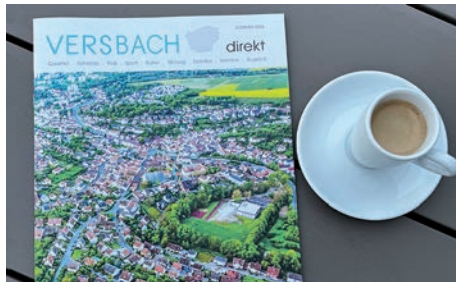
neue Stadtteilzeitung „Versbach direkt“