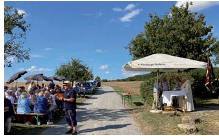
Festgesellschaft zum 25-jährigen Jubiläum