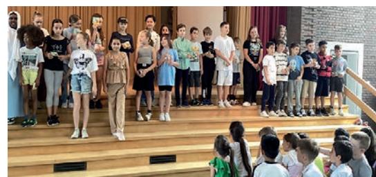
Schüler-innen bei der Abschlussfeier an der Gustav-Walle Schule

Tel. 0931 24801 - pfarrei.versbach@ bistum-wuerzburg.de