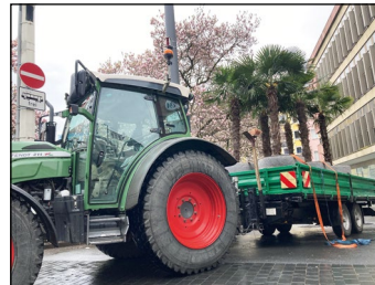
Die Palmen werden i. d. Kaiserstraße geliefert