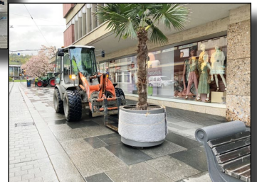
Verteilung der Palmen in der Fußgängerzone