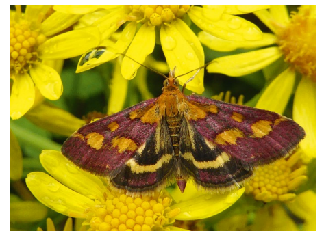
Der purpurrote Zünsler.