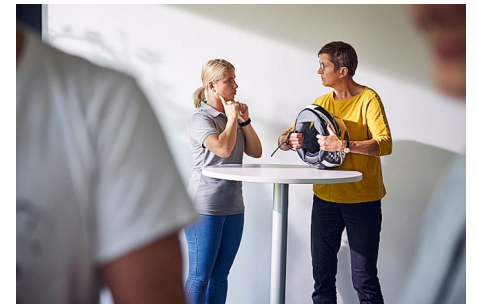
Bei den Erste-Hilfe-Kursen der Johanniter wird den Teilnehmenden gezeigt, wie man bei Motorradunfällen richtig Erste Hilfe leistet.

Solide, nachhaltig und robust - das sind